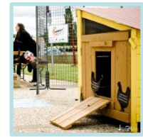
Poulailler réalisé par l'Esat de Flixecourt