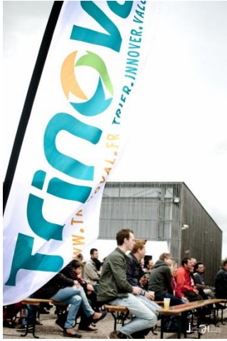
Repas réalisé par l'association De la Graine à l'Assiette et l'Esat de Flixecourt